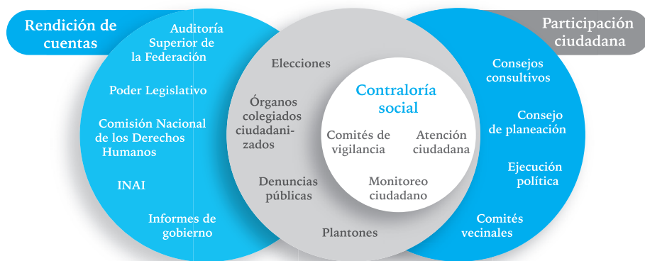
Figura 1. Esquema descriptivo de contraloría social

otro lado, estas instancias son institucionalizadas, es decir, están reguladas por medio de normas legales como leyes, reglas de operación, lineamientos, etc. Esto distingue a la contraloría social de otras formas de participación ciudadana orientadas al control social, pero que no se realizan por cauces formales o institucionales como las acciones directas, tomas de oficinas o espacios públicos, o plantones (figura 1).